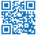
Audio-Guide für Kinder

Der Naturpark Schwarzwald Mitte/Nord, der größte Naturpark in Deutschland, ist ein Paradies für alle, die den Schwarzwald aktiv und naturverträglich erleben möchten.