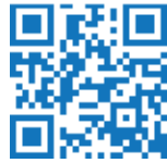
Audio-Guide für Erwachsene

Gehen Sie mit dem Flößer Johann und mit seinem Sohn Uli auf die Reise und hören Sie, wie die beiden die Kinzig hinuntersausen und was sie zu erzählen haben!